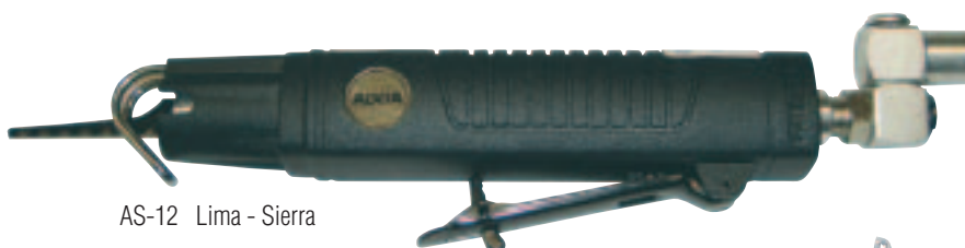
AS-12 Lima - Sierra