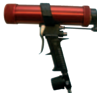
Con regulador de presión y válvula de descarga