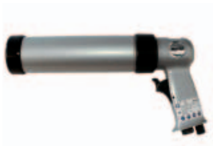
Con regulador de caudal