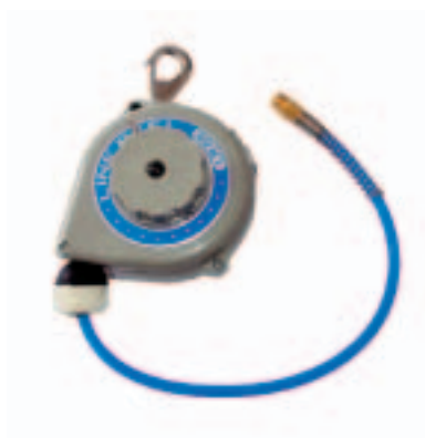
Equilibrador con manguera