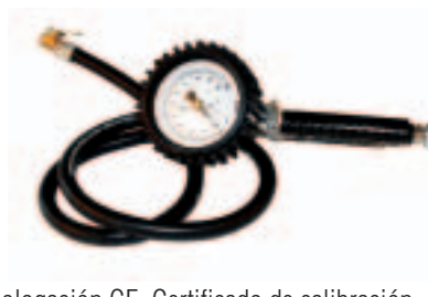
Homologación CE. Certificado de calibración