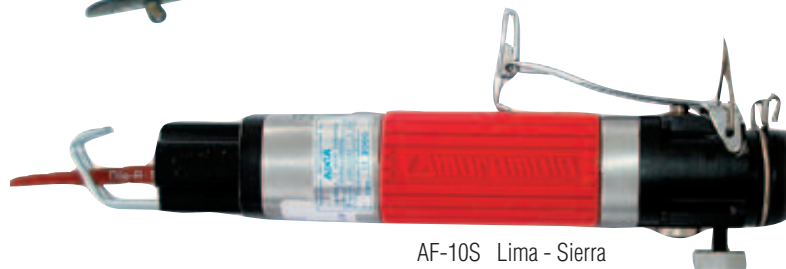
AF-10S Lima - Sierra