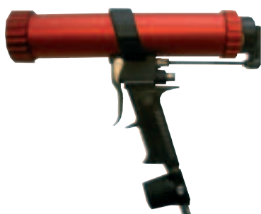
Con regulador de presión y válvula de descarga