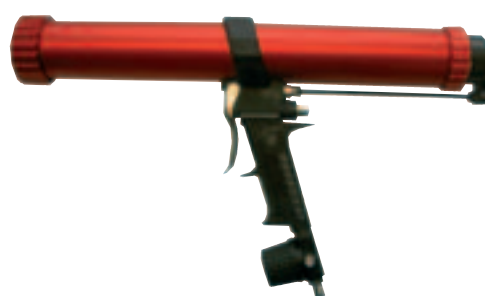
Con regulador de presión y válvula de descarga