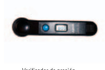
Verificador de presión