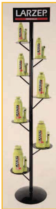
AZ9101 Expositor de gatos Display stand Presentoir