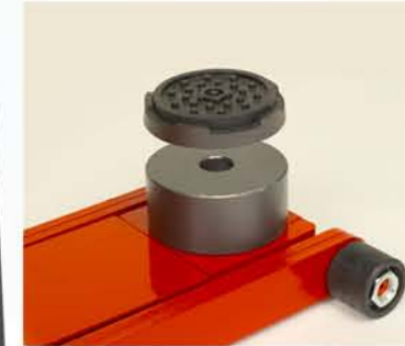
A-5182 Prolongador de 50 mm. Opcional