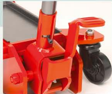
Pedal de aproximación rápida a la carga (excepto en el TJE-2).

El asa ergonómica con empuñadura de goma permite el manejo desde cualquier posición.