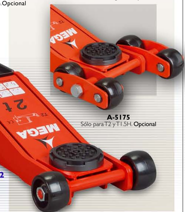
A-5175 Sólo para T2 y T1.5H. Opcional

Los modelos TJ mantienen sus características técnicas conocidas hasta su próxima adaptación al diseño marcado por los modelos T.