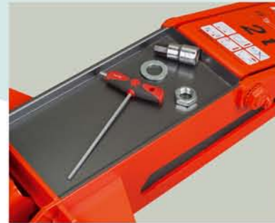
Bandeja portaobjetos (modelos T).