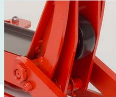
La rueda interior en los modelos T2X y T1.5H facilita una excelente maniobrabilidad.