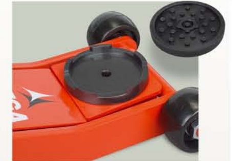
A-5181 Protección de goma. Opcional