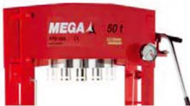
Cilindro deslizante a lo largo del cabezal en los modelos KPD.