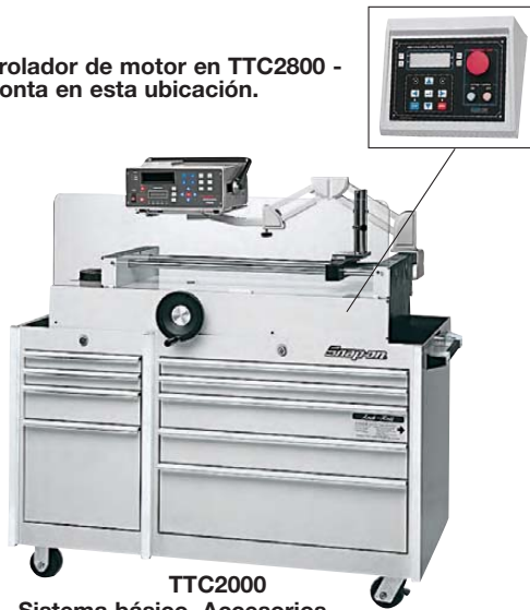
TTC2000 Sistema básico. Accesorios opcionales en la siguiente página.

Controlador de motor en TTC2800 - se monta en esta ubicación.